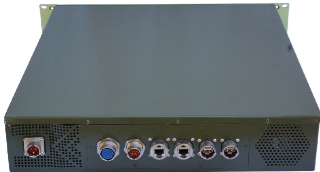
EIS-96C1 服务器 2U加固服务器